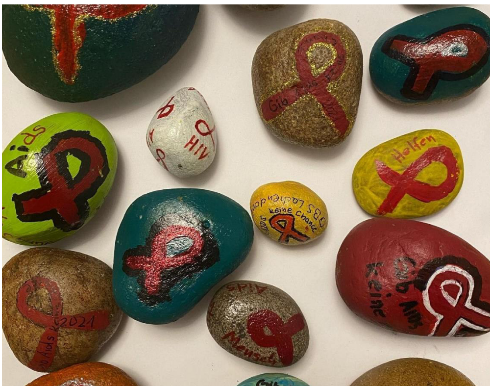
Die „Lichtesteine“, eine Aktion von Charles Sievers zum Welt-Aids-Tag 2021